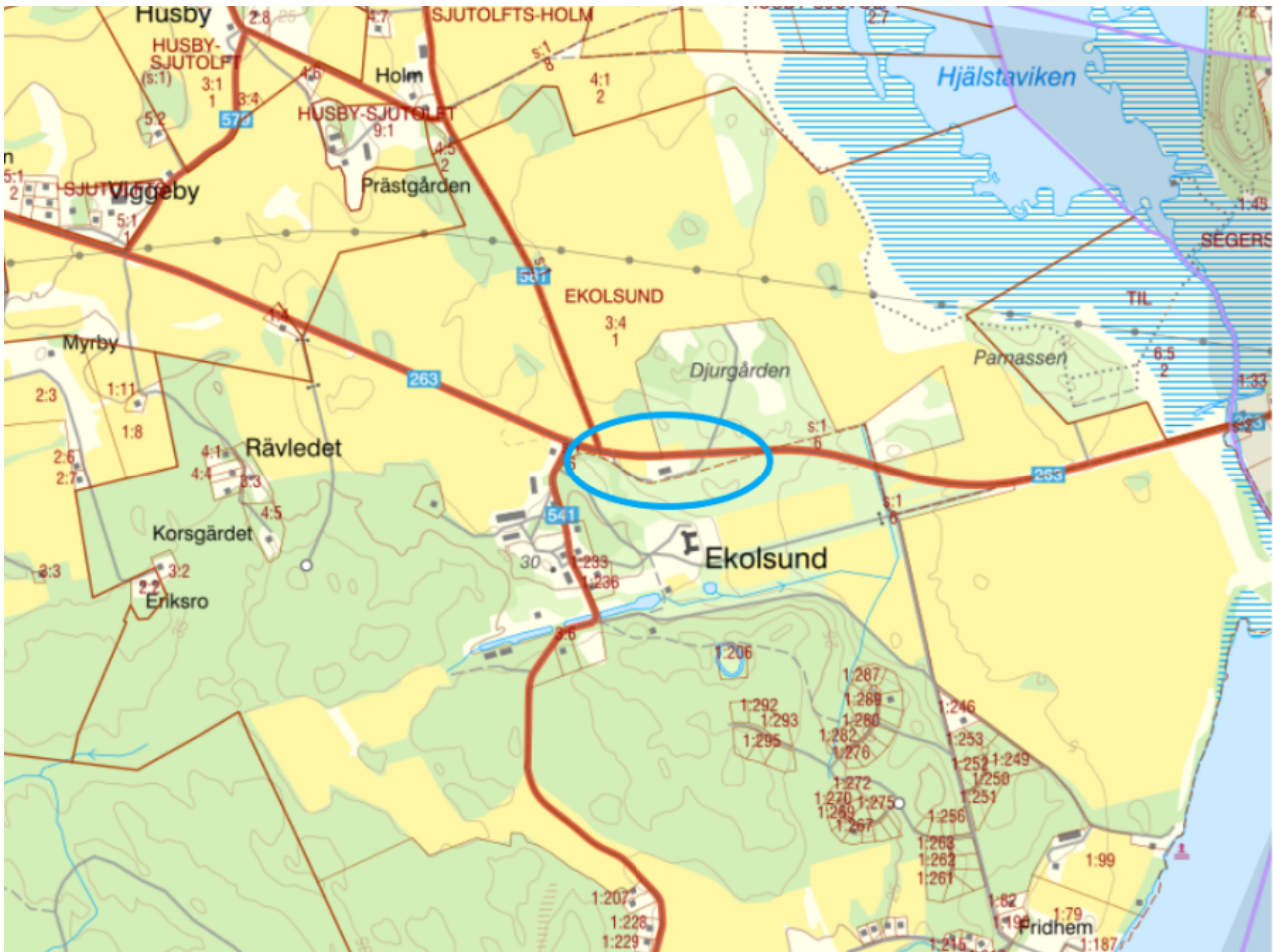
Planområdets läge i Enköping.